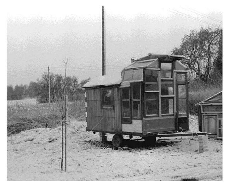
Figure 5: studio trailer, which contains the basics of visual creation: a table for drawing and an easel for painting, in 1982