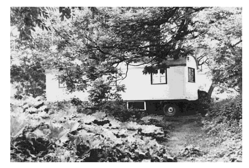
Figure 3: circus trailer Da Capo in 1982