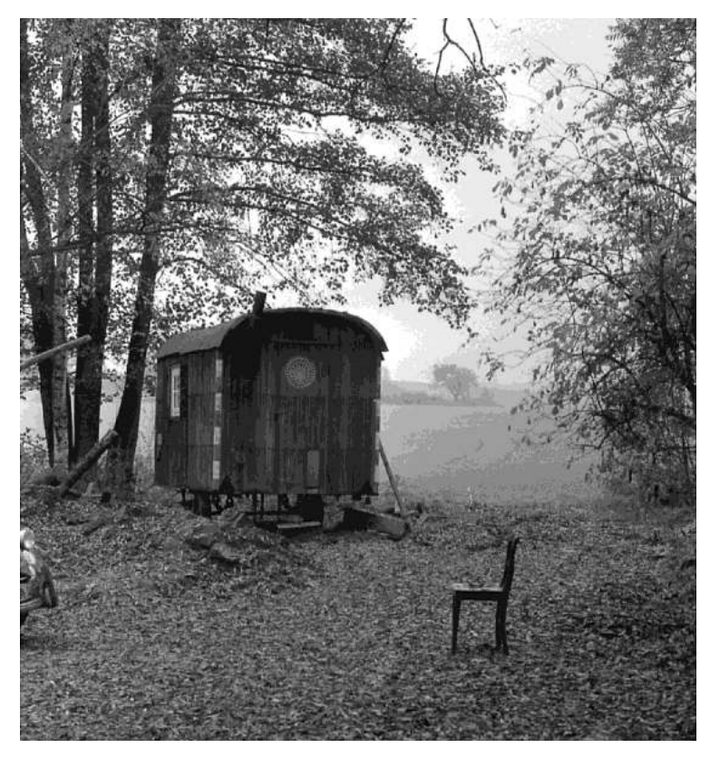
Figure 4: music trailer Al Fine, which contains a piano for giving music lessons, in 1982

우리는 서로 각자의 분야에서 대학원 과정을 마치는 동안 가까이서 우리의 문제에 집중하기 위하여 6년의 시간을 보냈다. 음악관과 건축대학 건물이 우아하게 근접하여 있는 플로리다 대학의 야자수 나무 밑에서 간단한 점심을 하며 서로 가까이서 교차